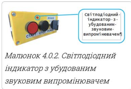
Малюнок 4.0.2. Світлодіодний індикатор з убудованим звуковим випромінювачем

При активації режиму відкладеного запуску оповіщення про надзвичайну ситуацію світлодіодний індикатор посту керування починає мигати із частотою один раз в 2-3 секунди.