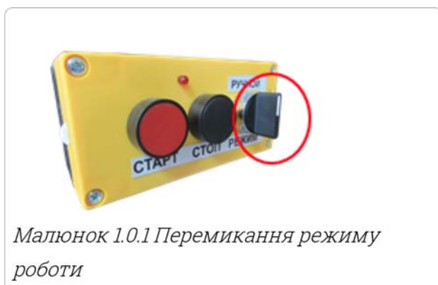
Малюнок 1.0.1 Перемикання режиму роботи

СРВНСО може працювати у двох режимах: ручному або автоматичному .